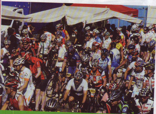
Col sol leone, ai ristoranti, bevande assalite: acqua e sali a go-go