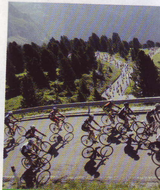
Intanto dietro si lotta tra tornanti e i suoi driftoni "it"