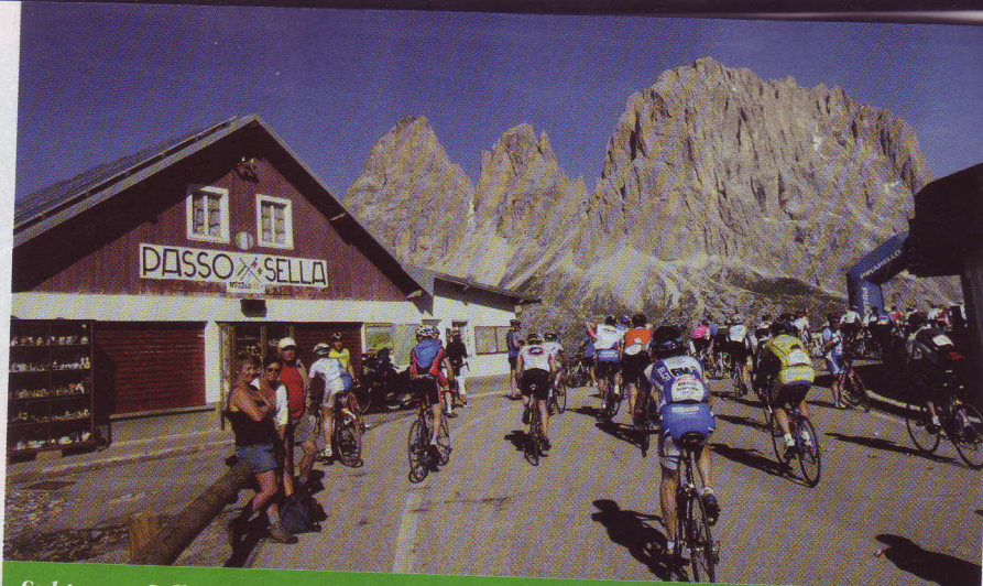
Sul passo Sella, il più duro dopo il Giau, una bella fetta della Maratona è alle spalle. Da qui si entra in Val Gardena col Sassolungo a dominare la scena...