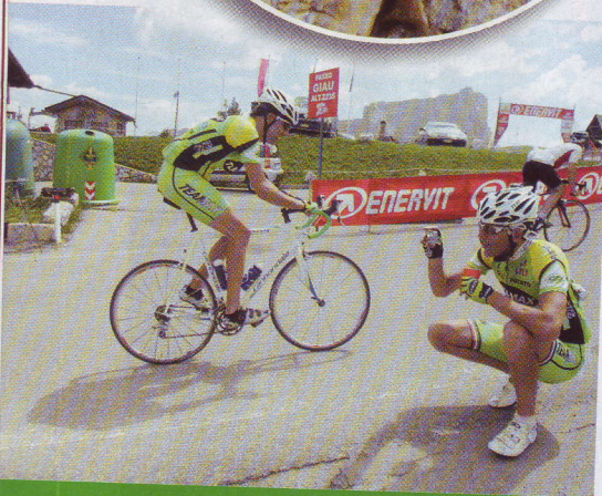
I ragazzi del Team Max si radunano sul Giau e scattano foto