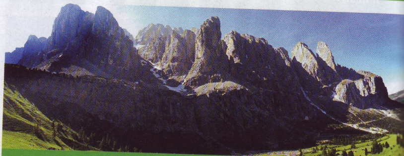
La Val Gardena ormai è passata, ma il suo splendore resta intatto. A sinistra, il Gruppo del Sella e sullo sfondo di nuovo il Sassolungo