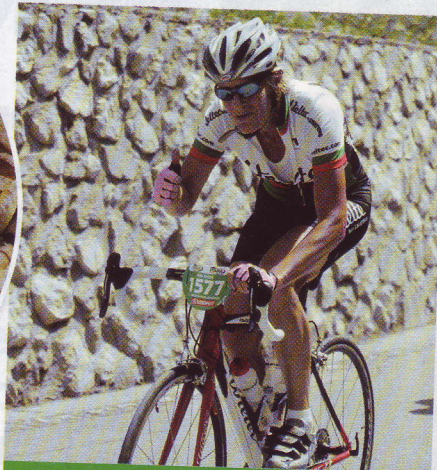
Giornata splendida e il buon umore non manca. A sinistra, lo strudel