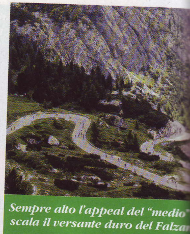
Sempre alto l'appello del "medio" scala il versante duro del Falzarego